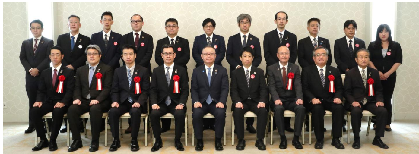
～ご来賓の皆様とMC&C労連中央執行委員三役～