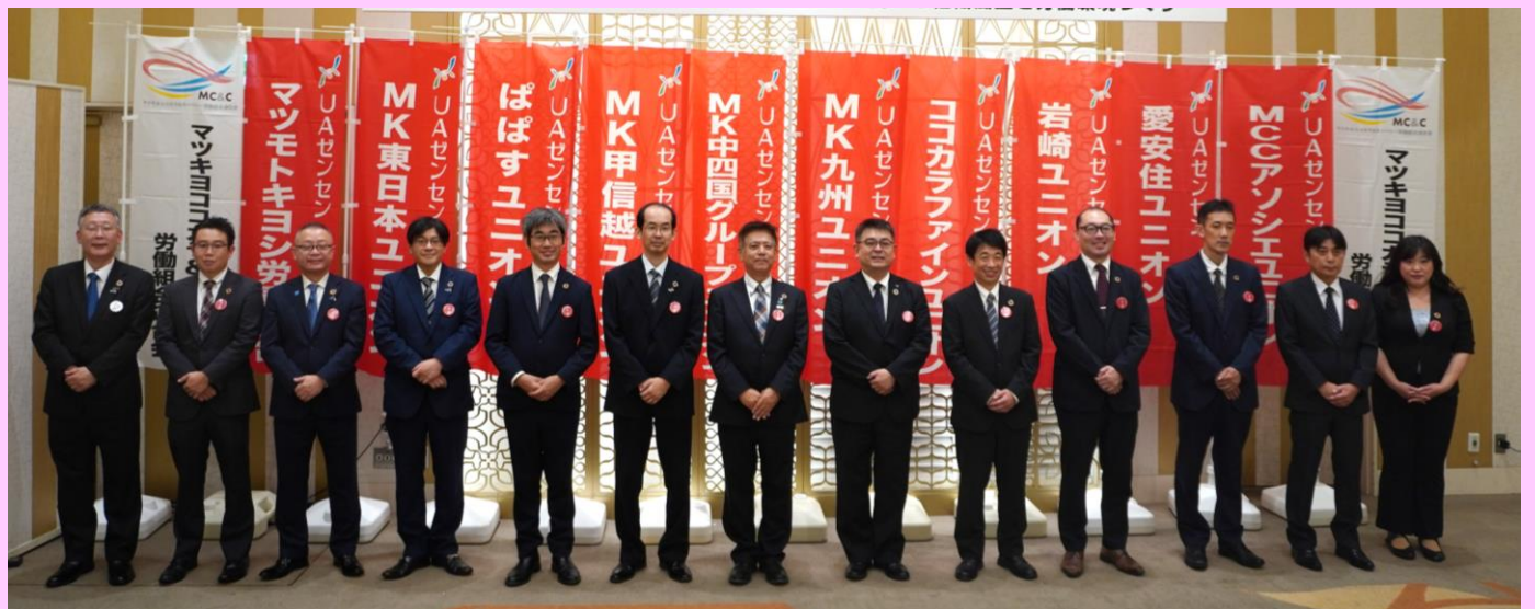
～労連中央執行委員三役（会長・副会長・事務局）集合写真～