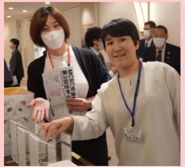
【署名&カンパ・募金風景】