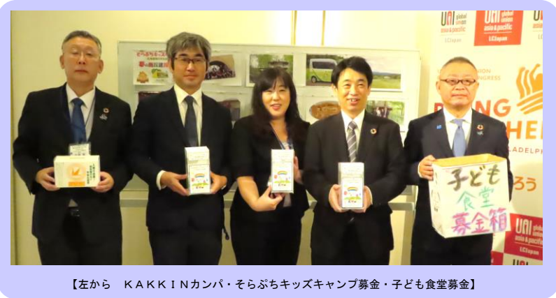
【左から KAKKINカンパ・そらぶちキッズキャンプ募金・子ども食堂募金】