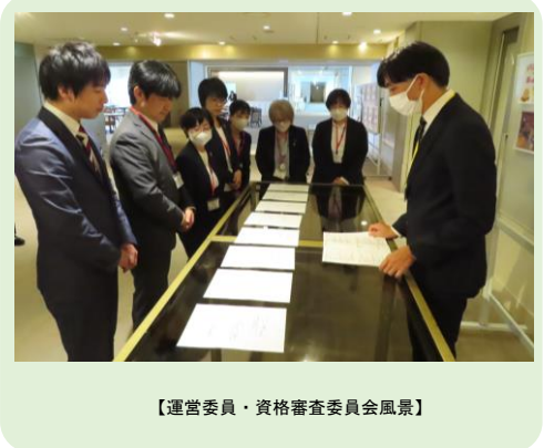
【運営委員・資格審査委員会風景】