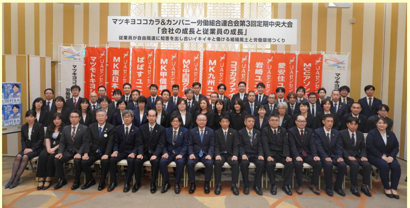
～大会会場出席集合写真～